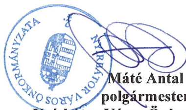
Máté Antal polgármester Nyírbátor Város Önkormányzata